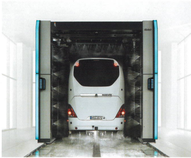
... und fügt sich harmonisch in die weitere Produktlinie ein.